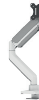
DS70PLUS-450BL1 / WH1 Dim. schermo: 17-49" Capacità: 18 kg/curvo 14 kg Testa rinforzata