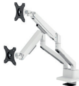
DS70-250BL2 / WH2 / SL2 Dim. schermo: 17-32" Capacità: 9 kg (2x)