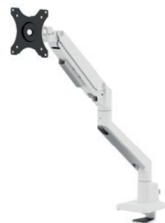
DS70-250BL1 / WH1 / SL1 Dim. schermo: 17-35" Capacità: 9 kg